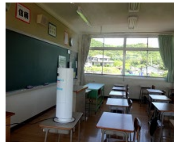
次亜塩素酸水での教室消毒