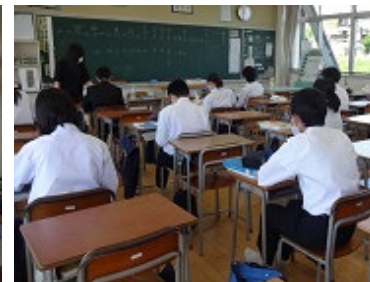
登校日の授業風景(分散登校)