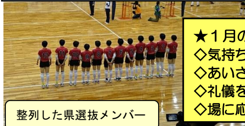
整列した県選抜メンバー