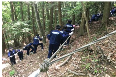
ブライントウォーク